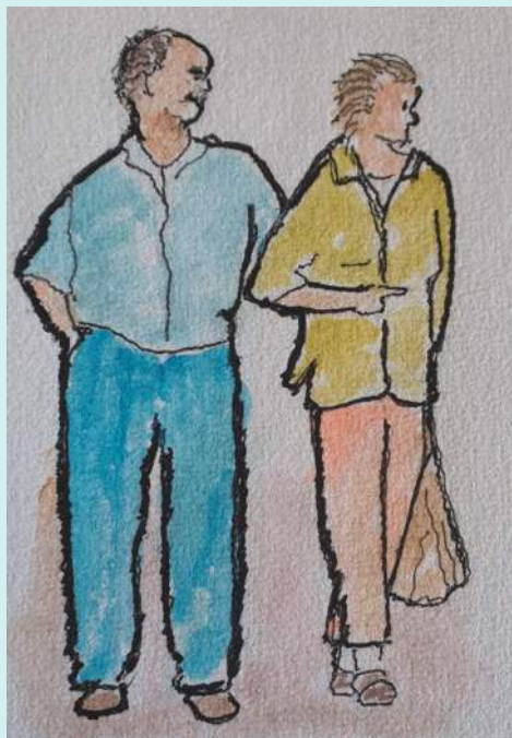
由CCSM的长期支持者创作的艺术作品