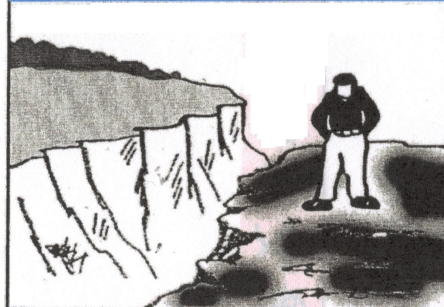
圖B --- 你的罪使你與神隔絕