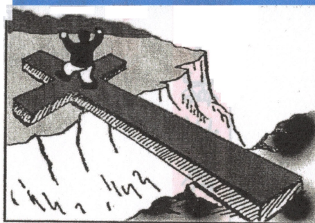
圖D --- 你可以成為神的兒女

B. 但是， 你是否知道 你的 罪 已在 你和 神 之間 形成一個 大的 鴻溝 ？ (回答:不知道)