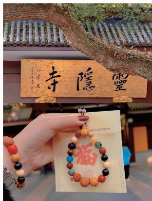
一所高中的2024年春季郊游活动参观了一座寺庙

对于我们这些曾在大学校园与学生进行过深入交流的人来说，这一切并不令人意外。显而易见，与西方学生相比，中国学生更加渴望填补内心的精神空虚。令人遗憾的是，在中国目前的社会环境下，学生拥有相对比较大的自由去追求神秘主义和玄学。然而，基督教——能够完全填补内心空虚的信仰——却不是可接受的选择。