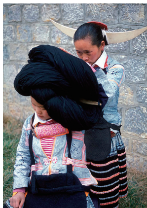
聚居於贵州西部的苗族微小分支——长角苗部落